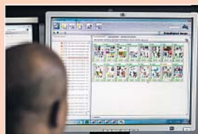
Het paginaplan geeft inzicht in de voortgang van het drukproces