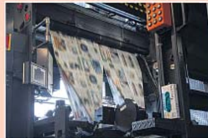
Het papier vliegt razendsnel door de pers