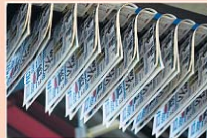
Transport in de expeditiehal