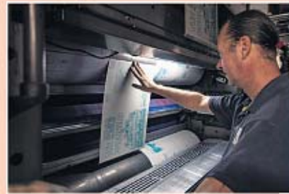
Een drukplaat wordt op de pers bevestigd