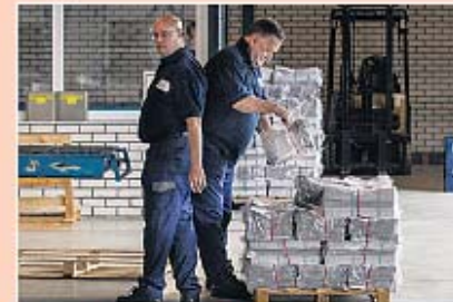
Klaar voor distributie