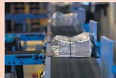
De kranten worden automatisch verpakt