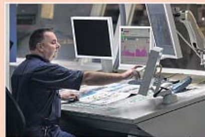
Drukpers checken voortdurend de verschillende instellingen